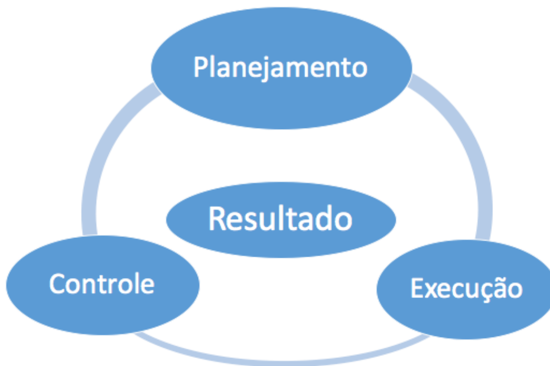
Figura 3 – Modelo de Gestão Adotado por Catelli (2011)

Retomando a citação do autor Catelli (2011), sobre a estruturação da gestão para atingir bons resultados, o modelo citado por ele, delimita o ciclo, contando com os passos de planejamento, execução e controle. Segundo o autor, na fase inicial de planejamento, faz-se necessário antecipar cenários, identificando as ameaças, oportunidades, pontos fortes e fracos da instituição, a fim de elaborar estratégias e políticas de atuação. Essa etapa norteará as fases de execução e controle, para que sejam realizadas de acordo com os planos estabelecidos.