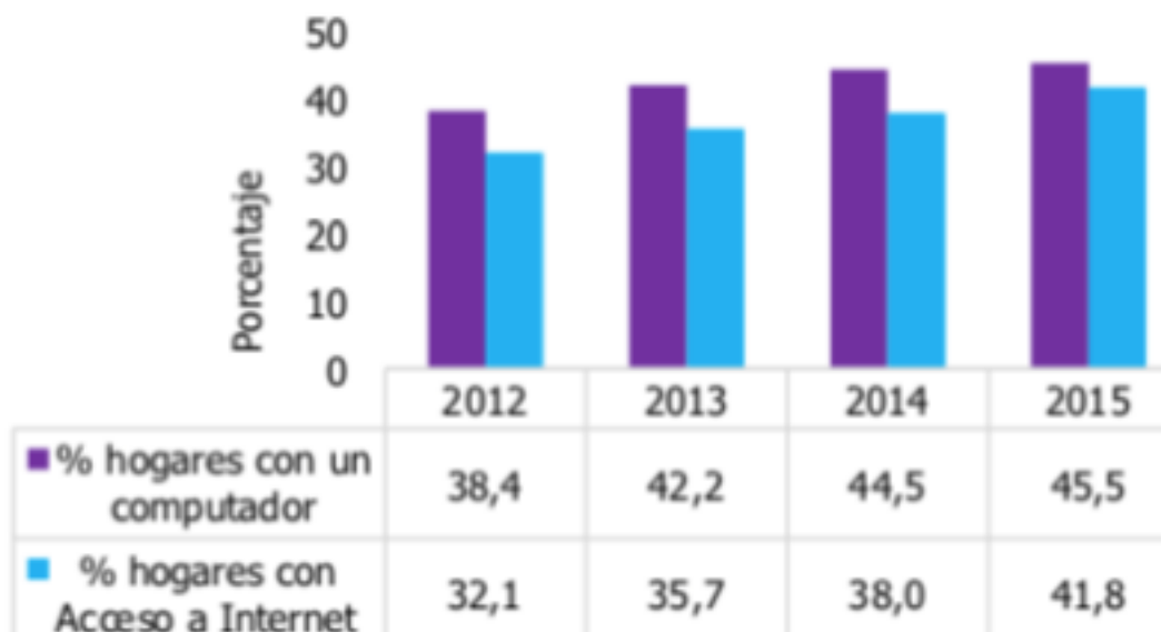
Figura 3 Porcentaje de hogares con computador y acceso a Internet