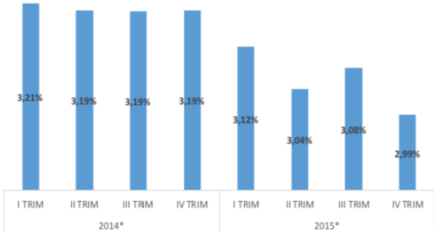
Figura 2 Participación del Sector Correos y Telecomunicaciones en el PIB